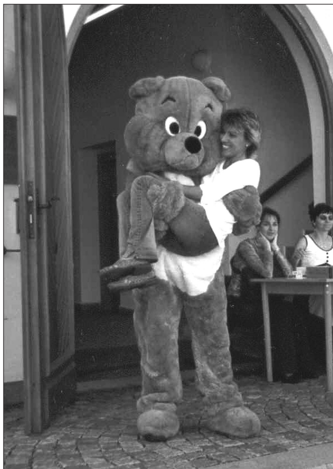
Nevěřili byste, jak příjemně je v náruči medvěda.

Delfín, pro jeho inteligenci. A také způsob jeho života.